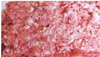
31311 Зам. «Полуфабрикат кост.куриный» вес пак Куриков СПК Куриков, ООО Срок годности: 6 мес