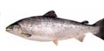
17368 Зам.рыба «Лосось» 4-5кг Чили Чили Срок годности: 24 мес