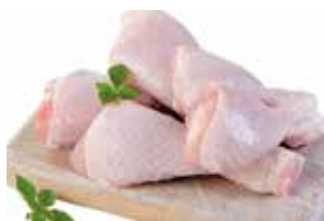
37615 Зам. Голень ЦБ, вес Ханжсин А.Д., ИП Срок годности: 9 мес