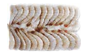
35406 Зам. «Креветки «Ванамей» в панцире, б/г, с/м, 16/20, блок 1,8 кг. Индия Срок годности: 24 мес