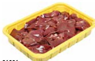
24304 Зам. «Печень ЦБ» подл.вес АФ Октябрьская Октябрьская АФ Срок годности: 6 мес