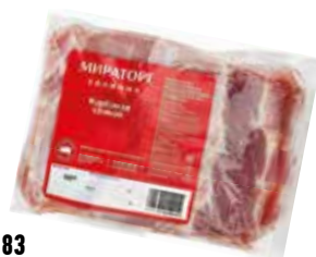
34383 Зам. «Карбонат свиной» б/к в/у -2,5кг Мираторг-Курск Мираторг-Курск РОССИЯ, ООО Срок годности: 24 мес