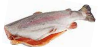
36196 Зам.рыба «Форель радужная ПБГ 0,9-1,8кг» Турция Спутник, ООО Срок годности: 18 мес