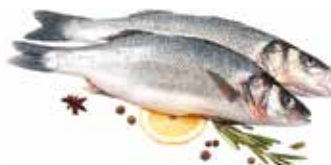
37344 Зам.рыба «Сибас н/р 300-400» Турция Спутник, ООО Срок годности: 18 мес