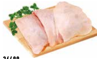
26489 Зам. «Бедро ЦБ» вес АФ Октябрьская Октябрьская АФ Срок годности: 6 мес