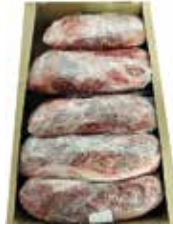
28739 Зам. «Шея свиная» вес Кстовский МК Кстовский мясокомбинат, ООО Срок годности: 12 мес