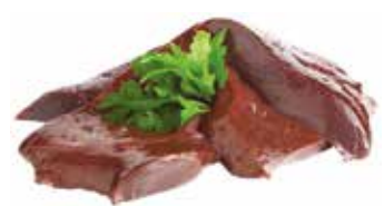
36733 Зам. «Печень говяжья» вес (т) Купецъ ТД, ООО Срок годности: 6 мес