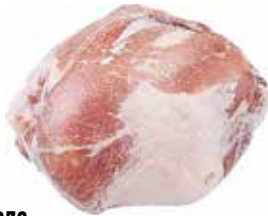
36073 Зам. «Окорок свиной» б/к вес Россия Срок годности: 6 мес