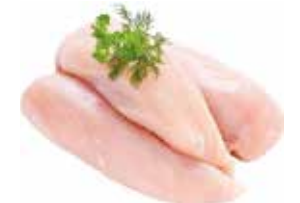
31967 Зам. «Филе Грудки ЦБ» вес Курников СПК Курников, ООО Срок годности: 9 мес