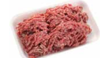
25954 Зам. «Фарш куриный» натур. 1кг подл ТМ Дарина АМЕДИ ВОЛГА АМЕДИ ВОЛГА, ООО Срок годности: 6 мес