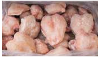
25931 Зам. «Грудка цыплят-бройл.» вес ТМ Дарина АМЕДИ ВОЛГА АМЕДИ ВОЛГА, ООО Срок годности: 8 мес