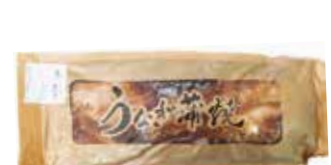
36547 Зам. «Кларий угревидный (филе пангасиу- са) в соусе унаги» Царская рыба, ООО Срок годности: 12 мес