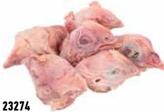
23274 Зам. «Головы ЦБ» мон вес 10-12кг АФ Октябрьская Октябрьская АФ Срок годности: 6 мес