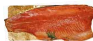
37345 Зам.рыба «Филе масляной рыбы (Эсколар)» Трим С х/к 1,8-2,2 Апрельское Спутник, ООО Срок годности: 12 мес