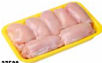
27508 Зам. «Филе бедра цыплят-бройл.б/к» вес подл ТМ Дарина АМЕДИ ВОЛГА АМЕДИ ВОЛГА, ООО Срок годности: 6 мес