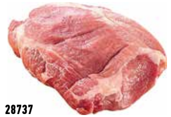
28737 Зам. «Лопатка свиная» вес Кстовский МК Кстовский мясокомбинат, ООО Срок годности: 6 мес