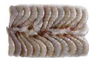
35408 Зам. «Креветки «Ванамей» в панцире, б/г, с/м, 21/25, блок 1,8 кг Индия Срок годности: 24 мес