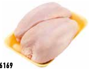
26169 Зам. «Грудка ЦБ» подл.вес АФ Октябрьская Октябрьская АФ Срок годности: 8 мес