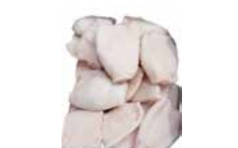
36209 Зам. «Кальмар Командорский тушка очищенный 1/3,5 кг» АОВК АОВК, ООО Срок годности: 6 мес