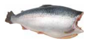
36195 Зам.рыба «Форель радужная ПБГ 1,8-2,7кг» Турция Спутник, ООО Срок годности: 18 мес