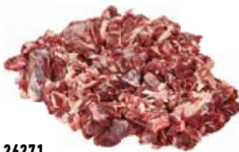
26271 Зам. «Говядина б/к» 2с вес Купецъ Купецъ ТД, ООО Срок годности: 6 мес