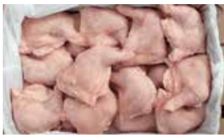
25933 Зам. «Окорочек цыплят-бройл.» вес ТМ Дарина АМЕДИ ВОЛГА АМЕДИ ВОЛГА, ООО Срок годности: 8 мес