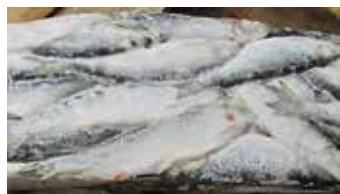
37424 Зам.рыба «Сельдь тихоокеанская н/р 200-300» Иня Рыболовецкая Артель «Иня» Срок годности: 24 мес