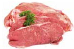
20148 Зам. «Лопатка свиная б/к» в/у 5кг*5 (25кг) СК Короча Россия Свинокомплекс Короча, ЗАО Срок годности: 24 мес