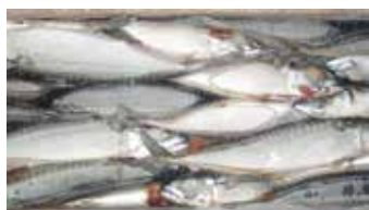
37685 Зам.рыба «Скумбрия атлант н/р 200-400» Эстер РТМКС К-2193 «Эстер» Срок годности: 12 мес