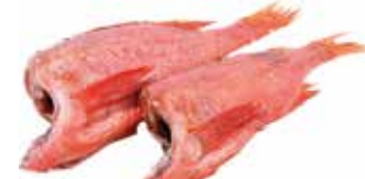
34512 Зам.рыба «Окунь 150-300» ФилеРос ФилеРос, ООО Срок годности: 9 мес