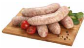
28520 Зам. «Купаты» Дачные» вес ТМ Дарина АМЕДИ ВОЛГА АМЕДИ ВОЛГА, ООО Срок годности: 6 мес