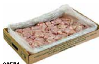
32571 Зам. «Филе Бедро ЦБ б/к» вес Курников СПК Курников, ООО Срок годности: 6 мес