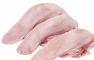
36064 Зам. «Язык свиной» вес Мираторг Мираторг ТК, ООО Срок годности: 24 мес