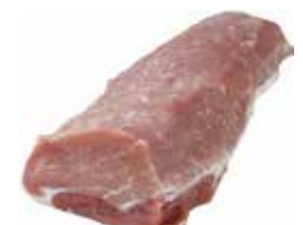
36075 Зам. «Карбонат свиной» б/к вес Россия Срок годности: 6 мес