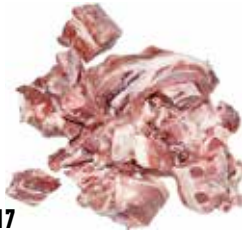
37717 Зам. «Мясо свинина реберный отруб на кости» (РАГУ) Кстовский мясокомбинат, ООО Срок годности: 12 мес