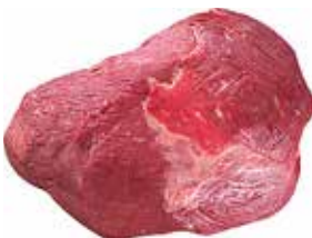
26267 Зам. «Огузок говяжий б/к» вес Купецъ Купецъ ТД, ООО Срок годности: 6 мес