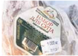
35792 Зам. «Набор для супа» ТУ вес пакет 1кг ТМ Дарина Амеди Волга АМЕДИ ВОЛГА, ООО Срок годности: 8 мес