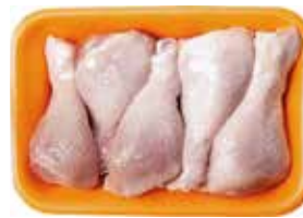
25930 Зам. «Голень цыплят-бройл.» вес подл ТМ Дарина АМЕДИ ВОЛГА АМЕДИ ВОЛГА, ООО Срок годности: 8 мес