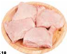
37619 Зам. Бедро цб с хребтом «Премиум», вес Ханжсин А.Д., ИП Срок годности: 9 мес