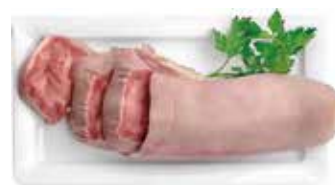
26272 Зам. «Язык говяжий» вес Купецъ Купецъ ТД, ООО Срок годности: 6 мес