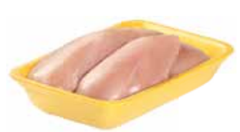
26165 Зам. «Филе ЦБ» подл.вес АФ Октябрьская Октябрьская АФ Срок годности: 6 мес