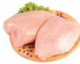
26170 Зам. «Грудка ЦБ» вес АФ Октябрьская Октябрьская АФ Срок годности: 8 мес