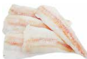
32780 Зам. «Филе минтая на коже» Рыбный двор Рыбный двор, ООО Срок годности: 5 мес