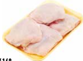
26168 Зам. «Бедро ЦБ» подл.вес АФ Октябрьская Октябрьская АФ Срок годности: 6 мес