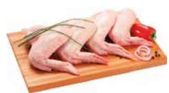
37622 Зам. Крыло цб, вес Ханжин А.Д., ИП Срок годности: 9 мес