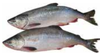
35508 Зам.рыба «Горбуша н/р» Островной РК Островной Срок годности: 12 мес