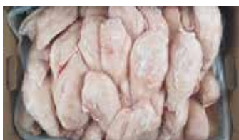
20700 Зам. «Филе грудки ЦБ «Эконом» вес Курников СПК Курников, ООО Срок годности: 6 мес