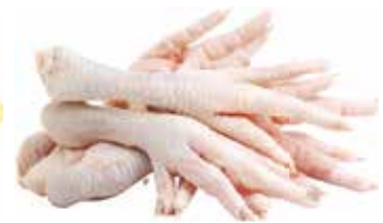
23276 Зам. «Ноги ЦБ» мон вес 10-12кг АФ Октябрьская Октябрьская АФ Срок годности: 6 мес