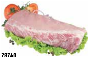
28740 Зам. «Карбонат свиной» вес Кстовский МК Кстовский мясокомбинат, ООО Срок годности: 6 мес