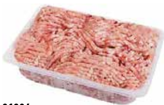
31286 Зам. «Фарш из мяса птицы» вес подл Павловская Курочка Павловская ПФ, ООО Срок годности: 6 мес