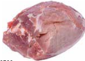
28738 Зам. «Окорок свиной» вес Кстовский МК Кстовский мясокомбинат, ООО Срок годности: 6 мес