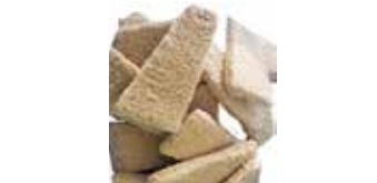
36753 Зам. «Котлеты рыбные» ТРЕУГОЛЬНИКИ тресковые/вес Экспродов ООО «Триада-Покторг» Срок годности: 12 мес