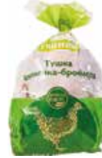
27568 Зам. «Тушка ЦБ» 1с вес инд.пак.АФ Октябрьская Октябрьская АФ Срок годности: 12 мес