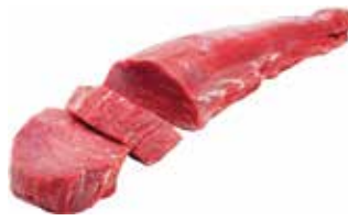
26265 Зам. «Вырезка говяжья б/к» вес Купецъ Купецъ ТД, ООО Срок годности: 6 мес