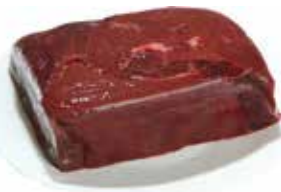
28850 Зам. «Печень свиная» вес Кстовский МК Кстовский мясокомбинат, ООО Срок годности: 6 мес