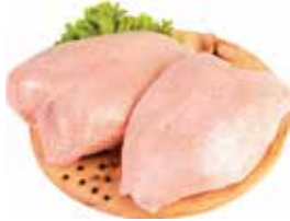
19929888 Зам. «Грудка цыплят-бройл.» вес Павловская Курочка Павловская ПФ, ООО Срок годности: 10 мес