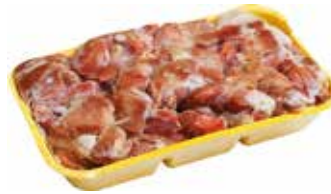
24305 Зам. «Желудки ЦБ» подл.вес АФ Октябрьская Октябрьская АФ Срок годности: 6 мес