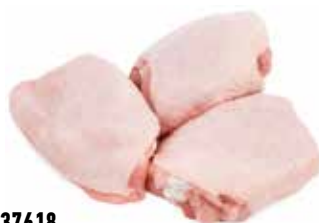
37618 Зам. Бедро цб с хребтом, вес Ханжсин А.Д., ИП Срок годности: 9 мес