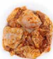
22833 Зам. «Набор д/чахохбили» вес Павловская Курочка Павловская ПФ, ООО Срок годности: 6 мес