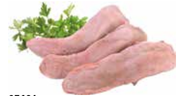
37194 Зам. «Язык свиной» фас Кстовский МК Кстовский мясокомбинат, ООО Срок годности: 6 мес