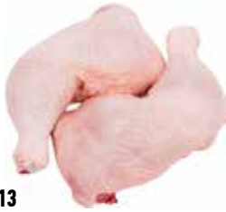
37613 Зам. Окорочок ЦБ с хребтом, вес Ханжсин А.Д., ИП Срок годности: 9 мес