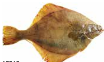
37727 Зам.рыба «Камбала н/р желтоперая М» Линдгольм Рыбоперерабатывающий завод «Сакра» РМС/Линдгольм, ООО Срок годности: 24 мес