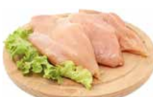
37621 Зам. Филе грудки цб «Премиум», вес Ханжсин А.Д., ИП Срок годности: 9 мес