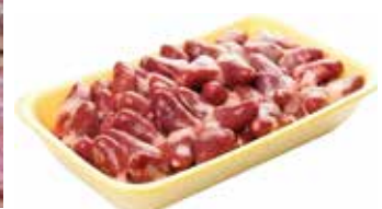
24307 Зам. «Сердце ЦБ» подл.вес АФ Октябрьская Октябрьская АФ Срок годности: 6 мес