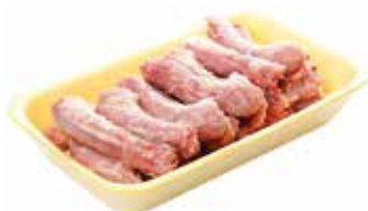
24306 Зам. «Шей ЦБ» подл.вес АФ Октябрьская Октябрьская АФ Срок годности: 6 мес