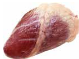
35635 Зам. «Сердце говяжье» вес Купецъ Купецъ ТД, ООО Срок годности: 6 мес