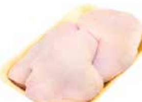
26167 Зам. «Окорочек ЦБ» подл.вес АФ Октябрьская Октябрьская АФ Срок годности: 8 мес