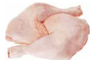
37614 Зам. Окорочек ЦБ с хребтом «Премиум», вес Ханжсин А.Д., ИП Срок годности: 9 мес