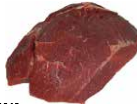
26269 Зам. «Лопатка говяжья б/к» вес Купецъ Купецъ ТД, ООО Срок годности: 6 мес