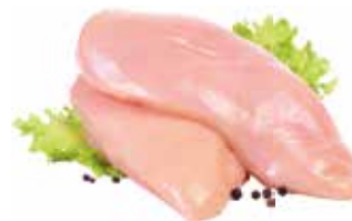
26166 Зам. «Филе ЦБ» вес АФ Октябрьская Октябрьская АФ Срок годности: 8 мес