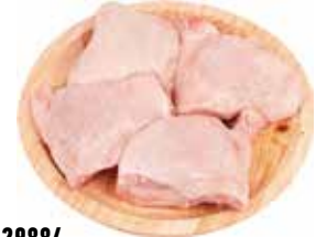
19929884 Зам. «Бедро цыплят-бройл. «Особое» вес Павловская Курочка Павловская ПФ, ООО Срок годности: 10 мес