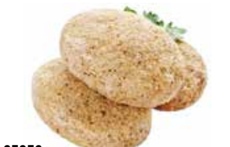
25953 Зам. «Котлеты куриные» вес ТМ Дарина АМЕДИ ВОЛГА АМЕДИ ВОЛГА, ООО Срок годности: 6 мес