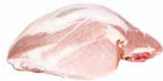
20149 Зам. «Окорок свиной б/к» в/у 9кг*3 (27кг) СК Короча Россия Свинокомплекс Короча, ЗАО Срок годности: 24 мес