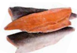
35873 Зам.рыба «Филе горбуши на коже» Рыбокомбинат СЭВКО Рыбокомбинат СЭВКО, ООО Срок годности: 10 мес