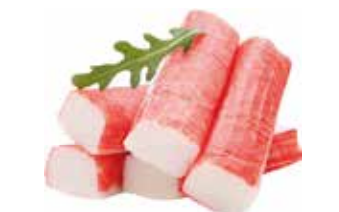
2020335 Зам. «Краб.палочки «Лунское море» 200г Вичюнайс-Русь, ООО Срок годности: 18 мес