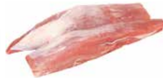
28736 Зам. «Вырезка свиная» вес Кстовский МК Кстовский мясокомбинат, ООО Срок годности: 6 мес