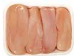
19929881 Зам. «Филе цыплят-бройл.» вес подл Павловская Курочка Павловская ПФ, ООО Срок годности: 10 мес