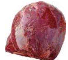
26266 Зам. «Оковалок говяжий б/к» вес Купецъ Купецъ ТД, ООО Срок годности: 6 мес