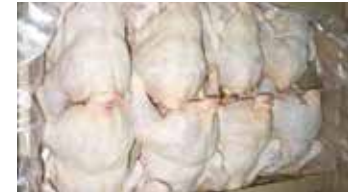
27051 Зам. «Тушка ЦБ» 1с вес АФ Октябрьская Октябрьская АФ Срок годности: 8 мес