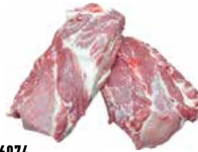
36074 Зам. «Шейка свиная» б/к вес Россия Срок годности: 6 мес