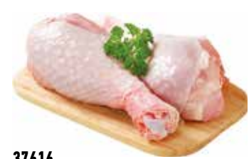
37616 Зам. Голень ЦБ «Премиум», вес Ханжсин А.Д., ИП Срок годности: 9 мес