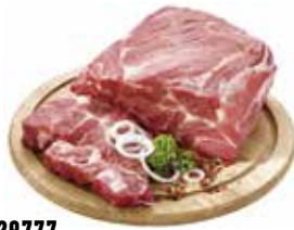
19929777 Зам. «Шейка свиная» в/у вес (2,4кг х8) Белгород Свинокомплекс Короча, ЗАО Срок годности: 24 мес