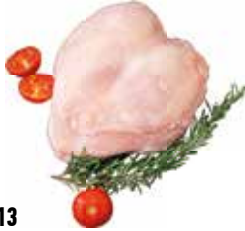
37713 Зам. грудка ЦБ с кожей Ханжсин А.Д., ИП Срок годности: 9 мес