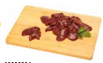
19929906 Зам. «Печень цыплят-бройл.» вес Павловская Курочка Павловская ПФ, ООО Срок годности: 6 мес