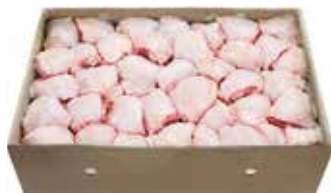
25927 Зам. «Бедро цыплят-бройл.» вес ТМ Дарина АМЕДИ ВОЛГА АМЕДИ ВОЛГА, ООО Срок годности: 8 мес