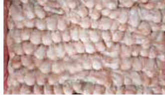
26164 Зам. «Крыло ЦБ» вес АФ Октябрьская Октябрьская АФ Срок годности: 8 мес