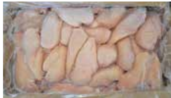
25937 Зам. «Филе цыплят-бройл.» вес ТМ Дарина АМЕДИ ВОЛГА АМЕДИ ВОЛГА, ООО Срок годности: 6 мес