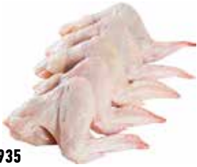
25935 Зам. «Крыло цыплят-бройл.» вес ТМ Дарина АМЕДИ ВОЛГА АМЕДИ ВОЛГА, ООО Срок годности: 8 мес