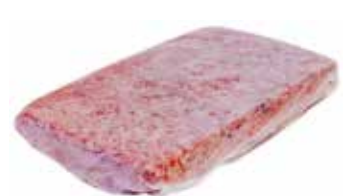
25956 Зам. «Костный остаток» 1кг пакет ТМ Дарина АМЕДИ ВОЛГА АМЕДИ ВОЛГА, ООО Срок годности: 3 мес