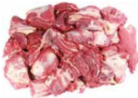
26270 Зам. «Говядина б/к» 1с вес Купецъ Купецъ ТД, ООО Срок годности: 6 мес