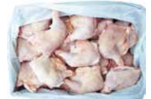
27423 Зам. «Окорочек ЦБ» вес АФ Октябрьская Октябрьская АФ Срок годности: 6 мес