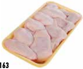
26163 Зам. «Крыло ЦБ» подл.вес АФ Октябрьская Октябрьская АФ Срок годности: 8 мес