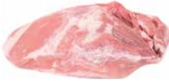
36072 Зам. «Лопатка свиная» б/к вес Россия Срок годности: 6 мес