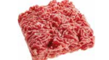
37798 Зам. Фарш популярный подл АМЕДИ ВОЛГА, ООО Срок годности: 6 мес